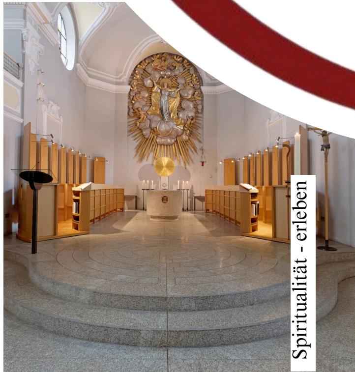
Spiritualität - erleben