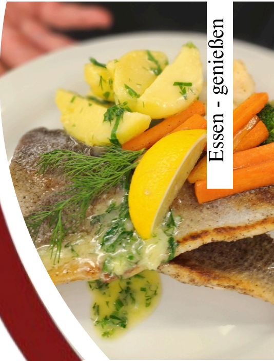
Essen - genießen