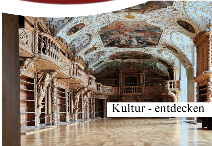
Kultur - entdecken