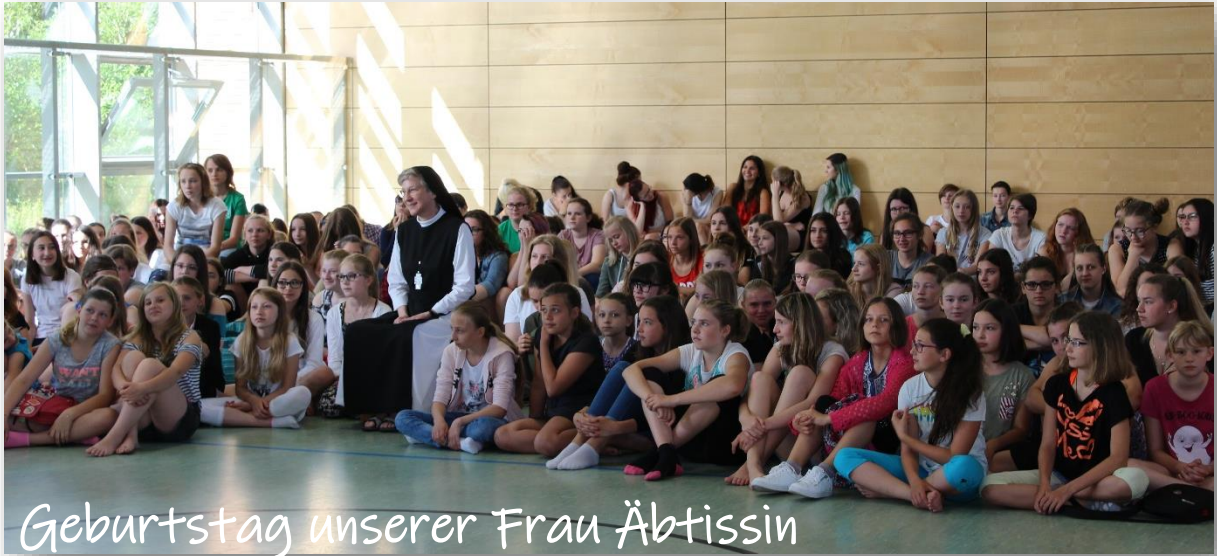
Geburtstag unserer Frau Äbtissin

Schulantrag Online – Anmeldung jetzt schon möglich – Leitfaden dazu auf der Homepage – Unsere Anleitung führt Sie durch